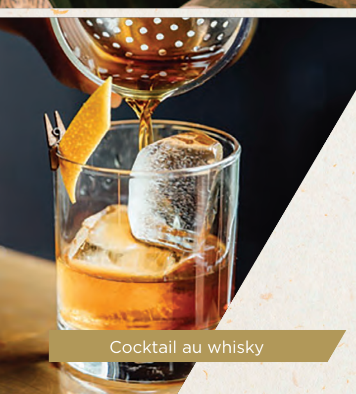
Cocktail au whisky